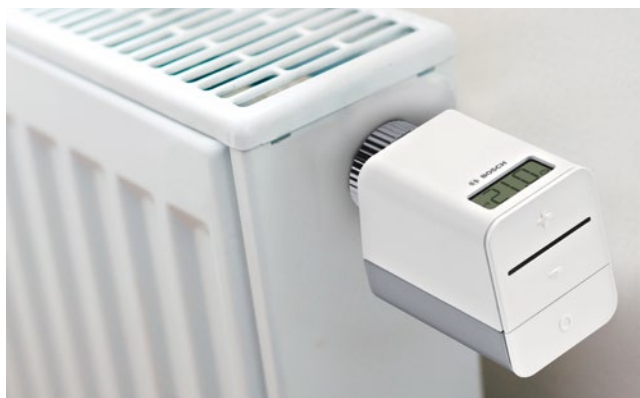
Bosch Smart Radiator Thermostat